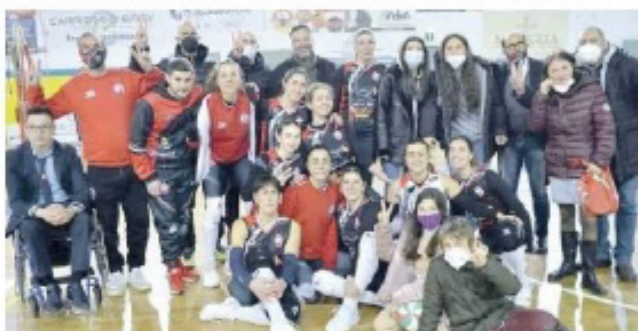
La squadra della Leo Constructions Monteroni Volley of complete con la dirigente